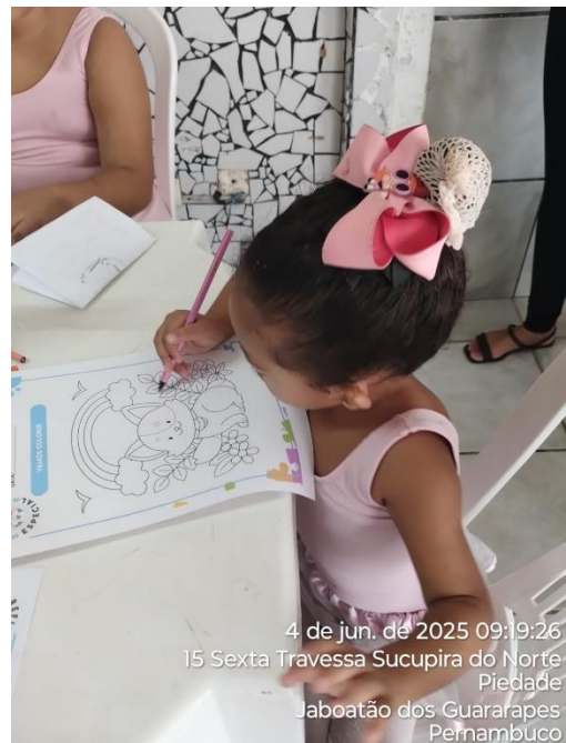
4 de jun. de 2025 09:19:26 15 Sexta Travessa Sucupira do Norte Piedade Jaboatão dos Guararapes Pernambuco