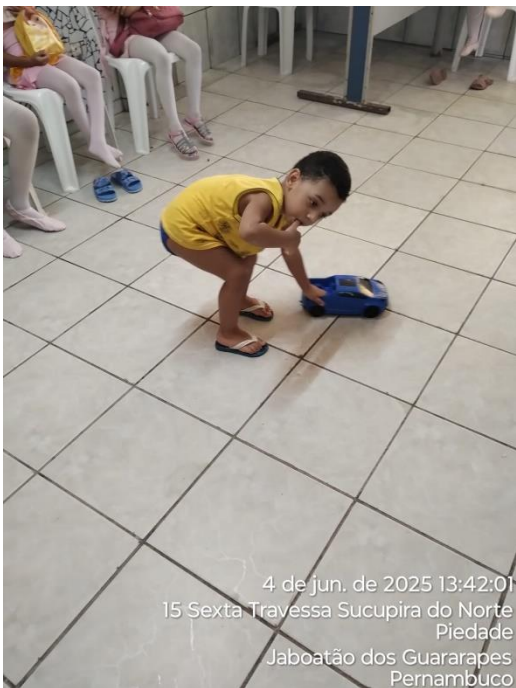
4 de jun. de 2025 13:42:01 15 Sexta Travessa Sucupira do Norte Piedade Jaboatão dos Guararapes Pernambuco