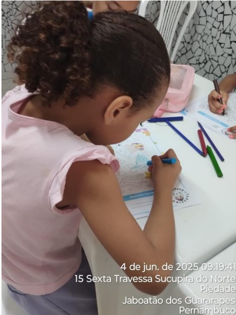
4 de jun. de 2025 09:19:41 15 Sexta Travessa Sucupira do Norte Piedade Jaboatão dos Guararapes Pernambuco