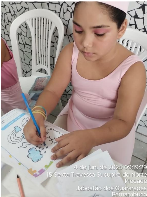
4 de jun. de 2025 09:19:29 15 Sexta Travessa Sucupira do Norte Piedade Jaboatão dos Guararapes Pernambuco