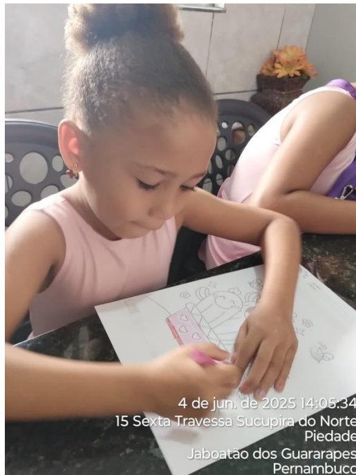
4 de jun. de 2025 14:05:34 15 Sexta Travessa Sucupira do Norte Piedade Jaboatão dos Guararapes Pernambuco