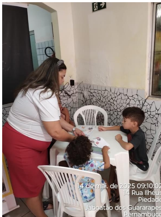
14 de mai. de 2025 09:10:02 14 Rua Ilhéus Piedade Jaboatão dos Guararapes Pernambuco