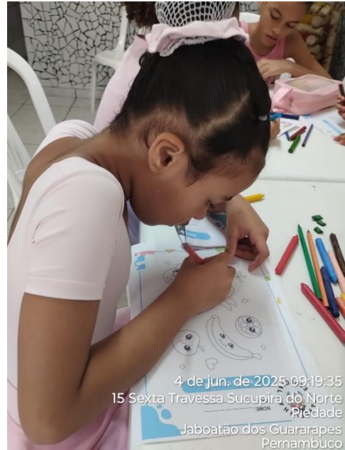
4 de jun. de 2025 09:19:35 15 Sexta Travessa Sucupira do Norte Piedade Jaboatão dos Guararapes Pernambuco